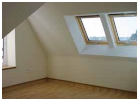
Une chambre du deuxième étage.