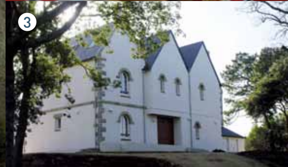
① L'hôtelierie Saint-Martin vue de la route. ② La cage d'escalier rénovée. ③ La façade nord de l'hôtelierie.