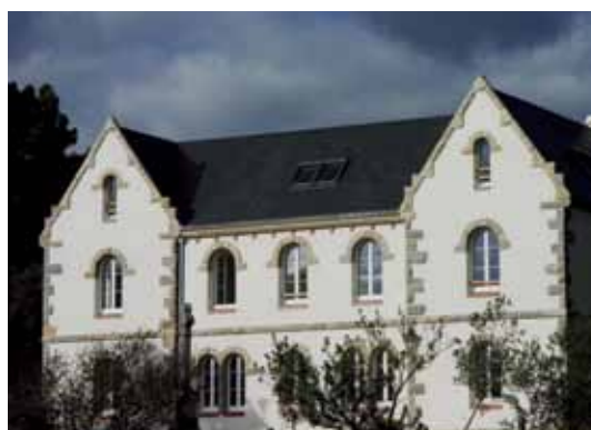
La façade Nord de l'hôtellerie.

Pour retenir une ou plusieurs chambres et demander des informations complémentaires sur l'hôtellerie, vous pouvez contacter le Père hôtelier par e-mail à l'adresse suivante : hotellerie@kergonan.org