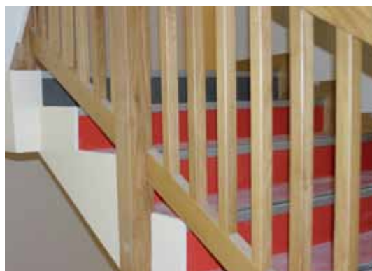
Le nouvel escalier.